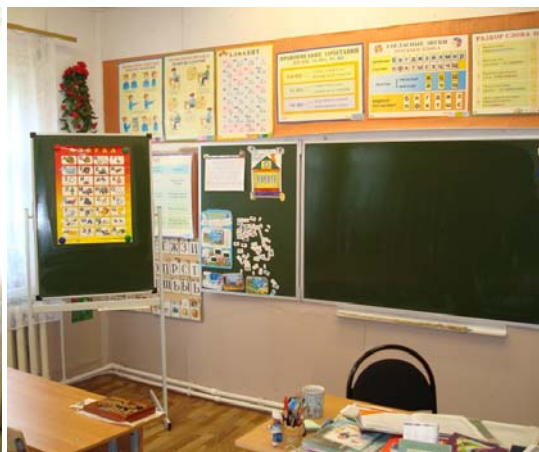
кабинет начальных классов