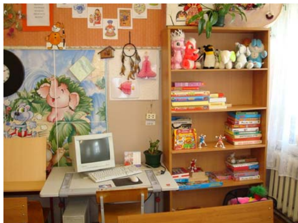
кабинет начальных классов